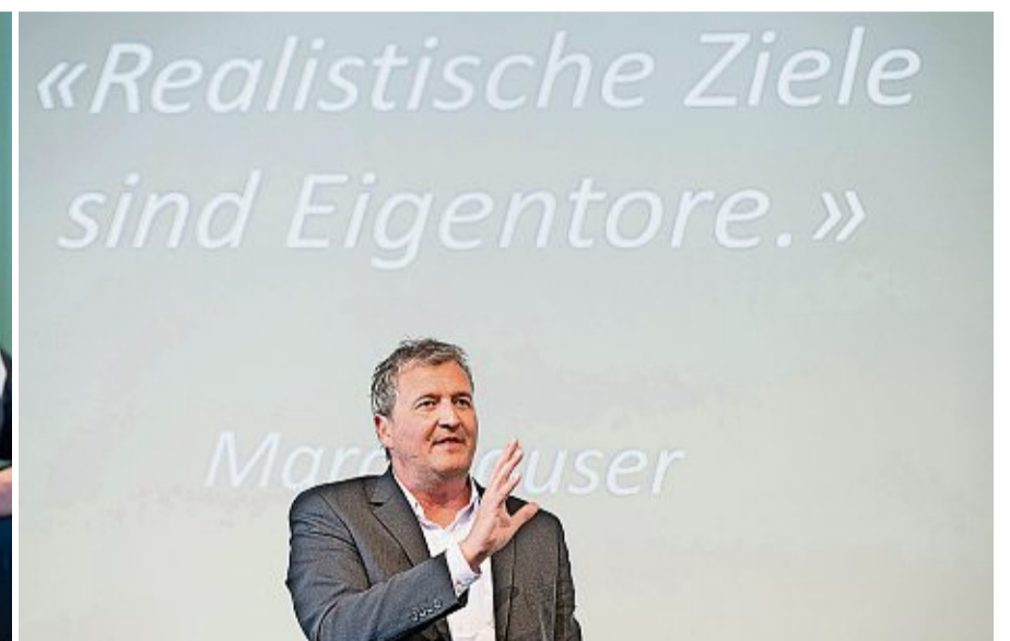
Der Abenteurer und Rekordhalter Marc Hauser stellt das Publikum auf die Probe.